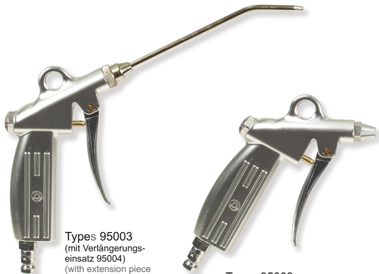
Types 95003 (mit Verlängerungseinsatz 95004) (with extension piece 95004)