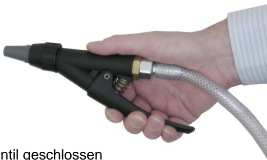
Ventil geschlossen (kein Luftaustritt)

Beide Aufnahmen mit der Hand sind möglich