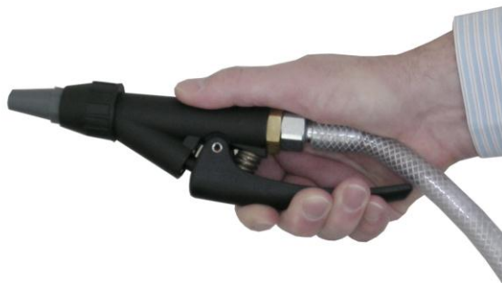
Ventil geöffnet (Luftaustritt vorhanden)